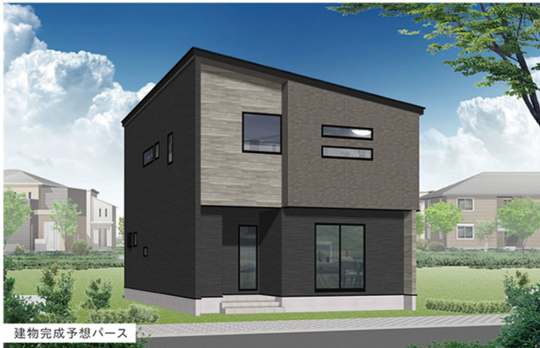
建物完成予想パース