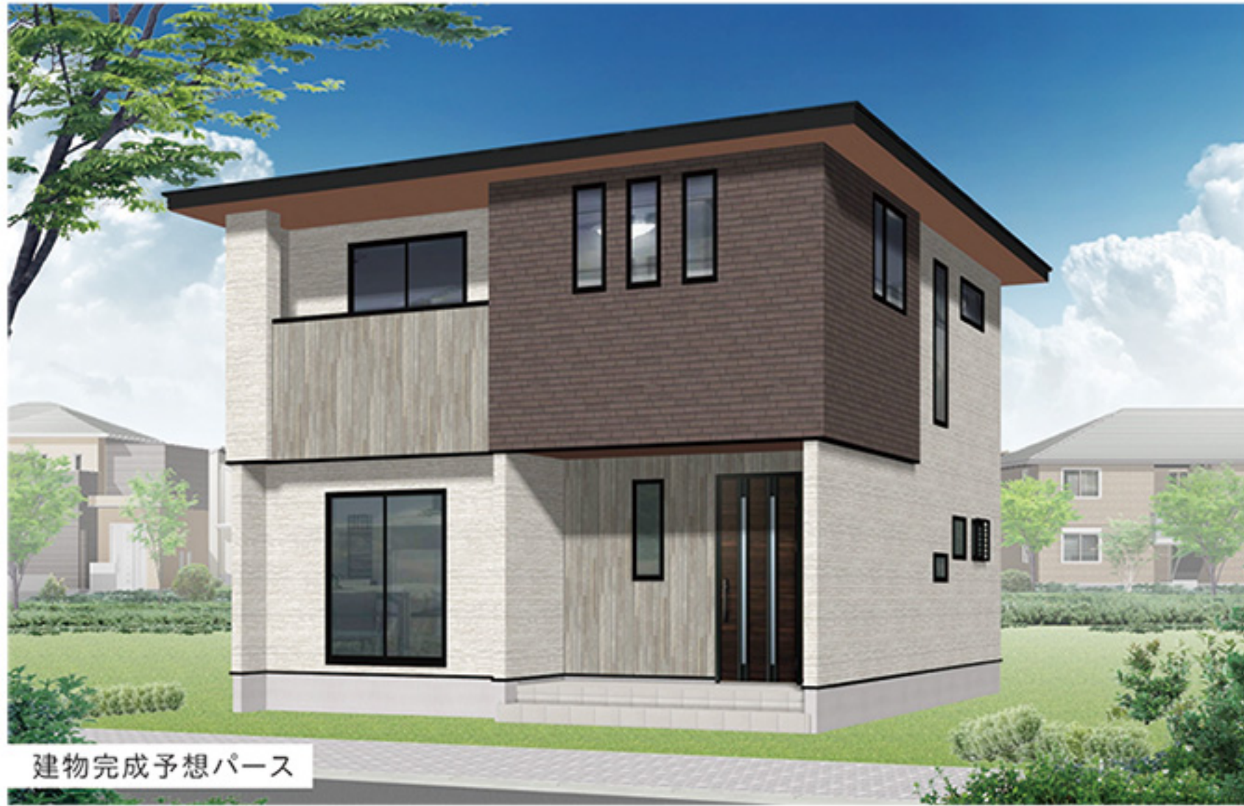
建物完成予想パース