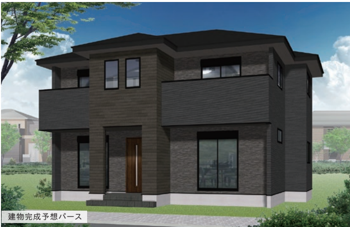
建物完成予想パース